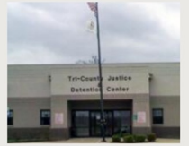
Pulaski County Detention Center

Chicago Field Office 2200 N. Seminary Ave. Woodstock, IL 60098