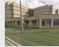
McHenry County Adult Correctional Facility

Chicago Field Office 2200 N. Seminary Ave. Woodstock, IL 60098